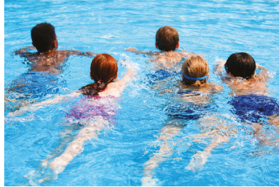
swimming in a pool