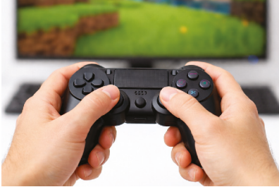
playing a computer game