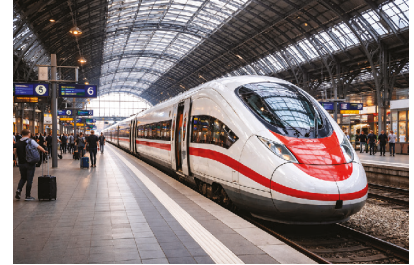
going by train