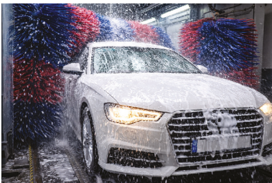
washing the car