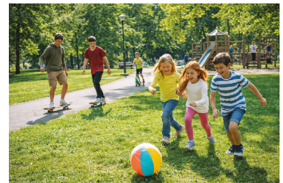
playing in the park