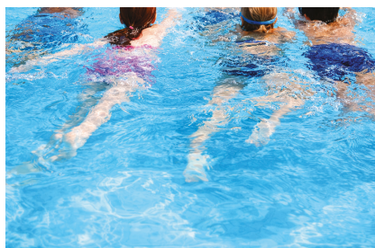
swimming in a pool