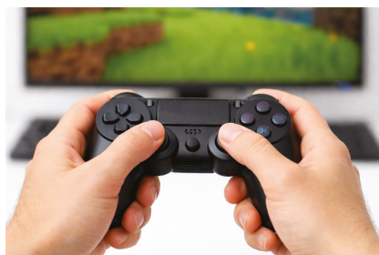
playing a computer game