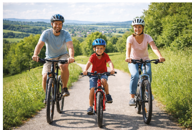
riding a bike